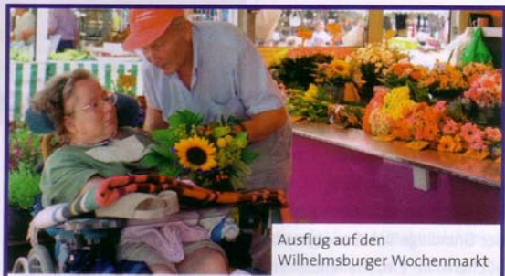
Ausflug auf den Wilhelmsburger Wochenmarkt